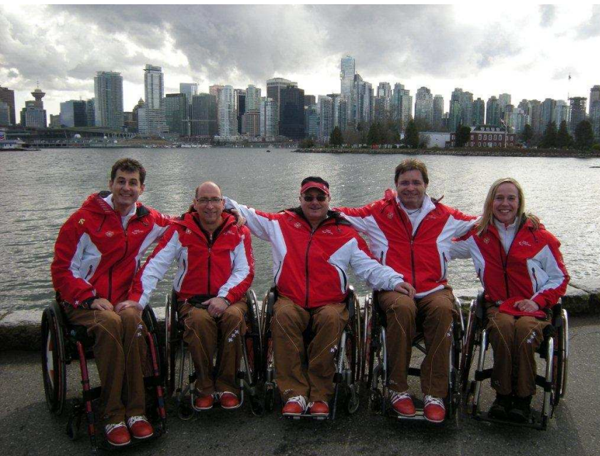
Das Rollstuhl-Curlingteam wohnt in Vancouver und musste nicht zweieinhalb Stunden zur Eröffnung anreisen.

Der erst 15jährige beinamputierte Snowboarder Zack Beaumont entzündete im Stadion die paralympische Flamme, die nun bis zum 21. März in Vancouver brennen wird. Offiziell eröffnet wurden die Spiele durch die kanadische General-Gouverneuerin Michaelle Jean. Auf dem Programm stehen 64 Entscheidungen in fünf Sportarten. Die Schweiz wird bei den Alpinen, im Rollstuhl-Curling, Biathlon und Langlauf vertreten sein.