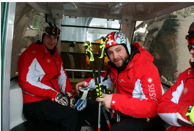
Für die Athleten heisst es: Rauf und nieder immer wieder.

Dass sich die Männer bei ihrer Verschiebe-Strategie nicht nur mit Ruhm bekleckerten, liegt bei den unterschiedlichen Interessen der Fahrer und Trainer, Organisatoren, Sponsoren und Zuschauern auf der Hand. Doch bei den alle vier Jahre stattfindenden Paralympics sollten nach Ansicht der meisten Beobachter sportlich faire Bedingungen herrschen.