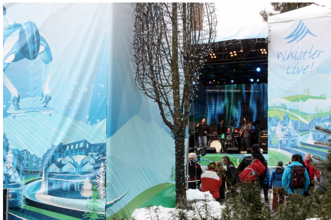
Live in Whistler: so tönen die 60er Jahre 2010