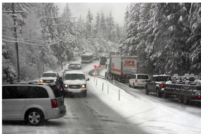
Chaos auf den Strassen in und um Whistler